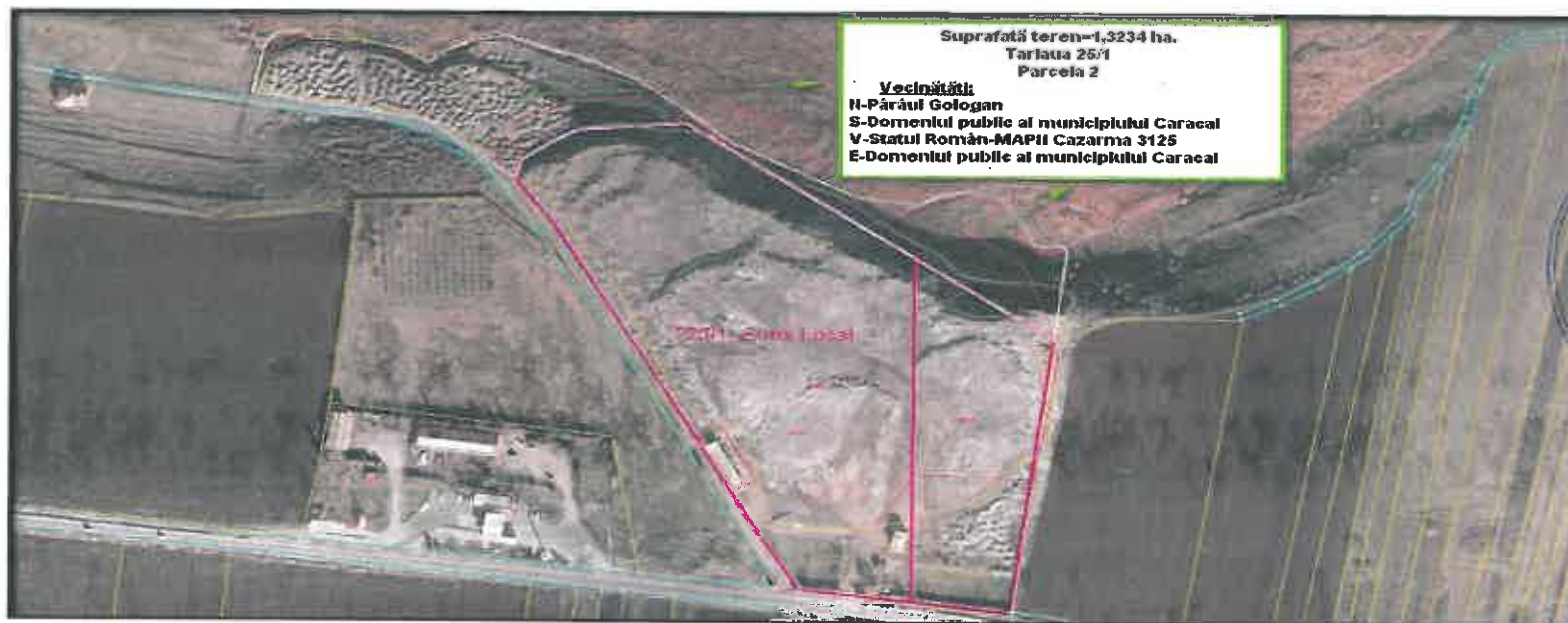
PLAN DE SITUAȚIE