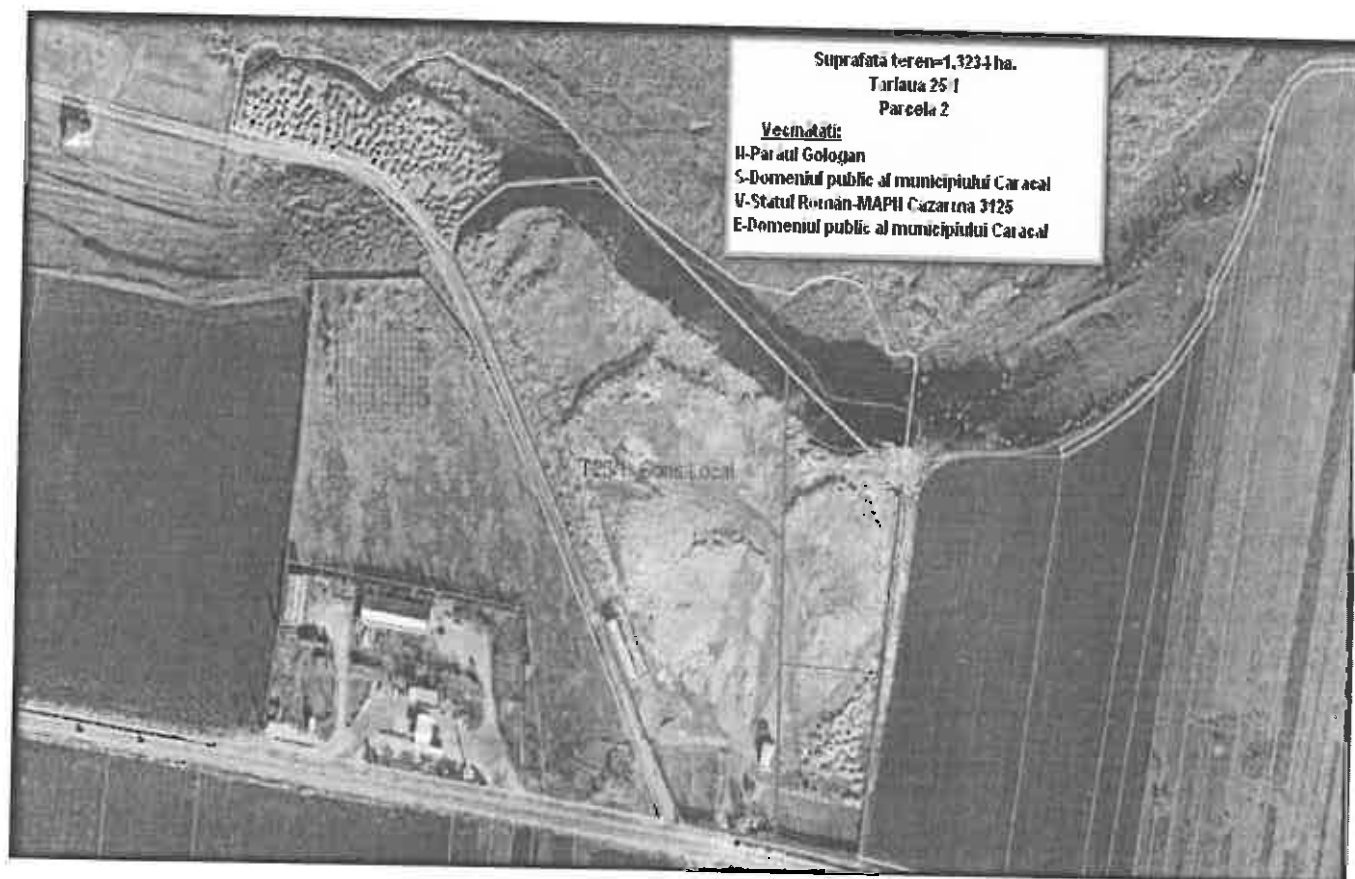
PLAN DE SITUAȚIE